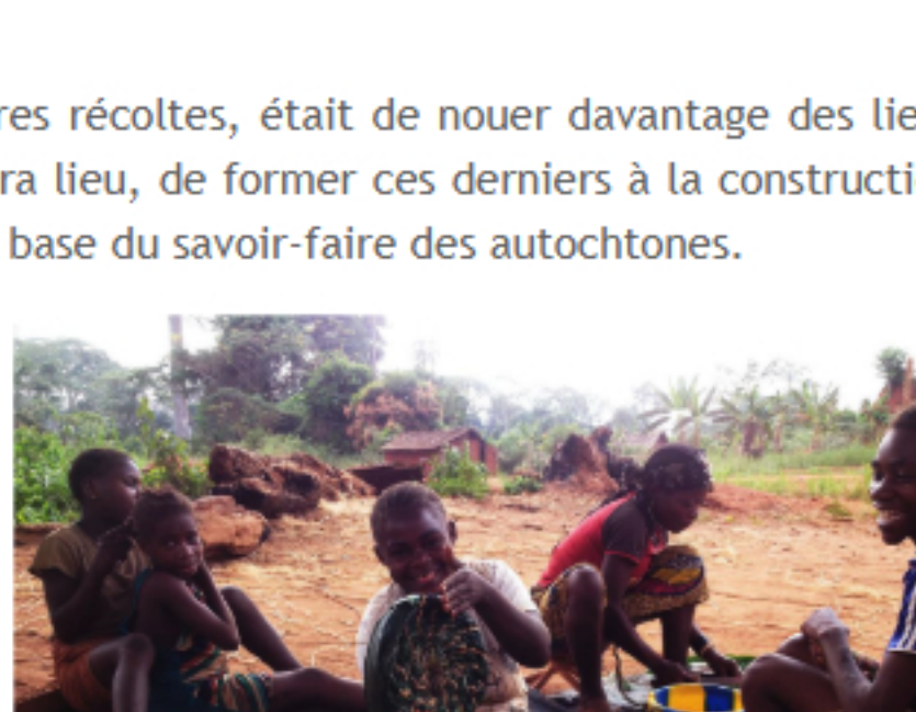
Confection des portes d'entrée des ruches tressées, Feuilles et lianes.

Un modèle de 30 ruches tressées a été donc réalisé à partir des matériaux de la forêt et celui-ci présente des avantages incontestables. Chaque personne formée en Novembre 2017, mais n'ayant pas de ruche Kenyane dans le passé, a bénéficié de quelques ruches pour commencer son petit élevage d'abeille. Quelques bantous aussi ont rejoint la formation.