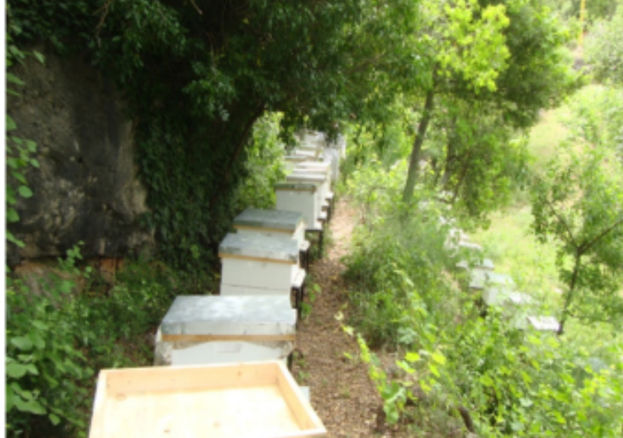
Les ruches installées

Le projet de Chahtoul, au nord est du Liban, qui a débuté en juin 2016, touche à sa fin. Celui-ci a été une initiative de la Conférence Saint Vincent de Paul qui gère un foyer d'accueil pour personnes âgées dans cette municipalité.