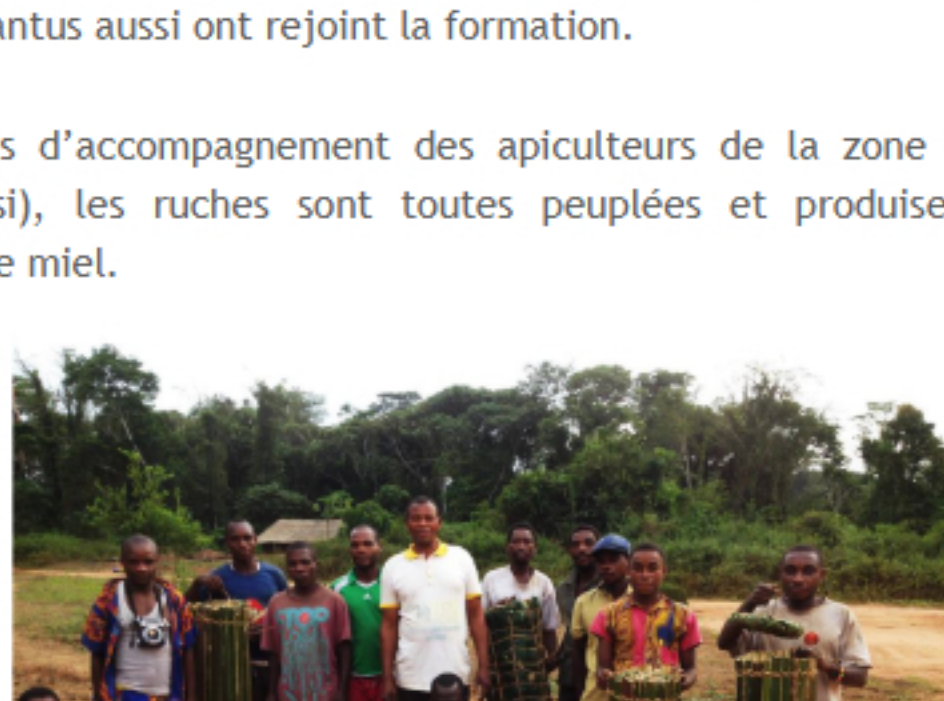
Certains apiculteurs avec des ruches tressées

l'engagement quotidien du superviseur local, de l'investissement et de la motivation des apiculteurs à la fois autochtones et bantous, mais aussi de la quantité de miel produit, l'Ordre de Malte participera financièrement à la construction d'une miellerie collective à M'Boua dans les mois à venir. Cette miellerie permettra de constituer un véritable point d'ancrage pour le développement de l'apiculture dans la Likouala.