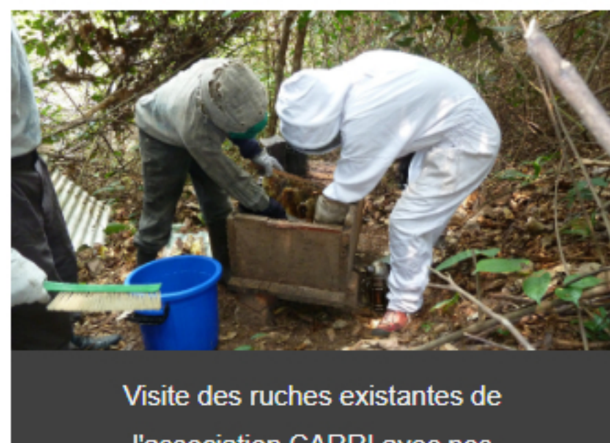
Visite des ruches existantes de l'association CARRI avec nos missionnaires.